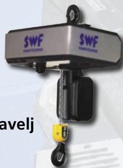
OH Obešanje na kavelj