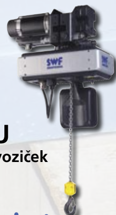
FNU Električni voziček