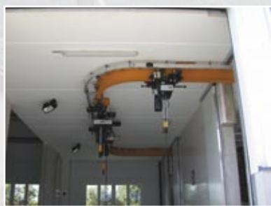
Verižna vitla za vožnjo v radijusu