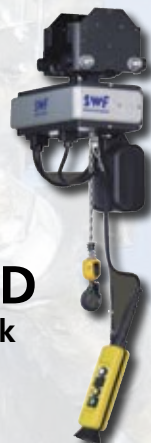
OH + FND Ročni voziček