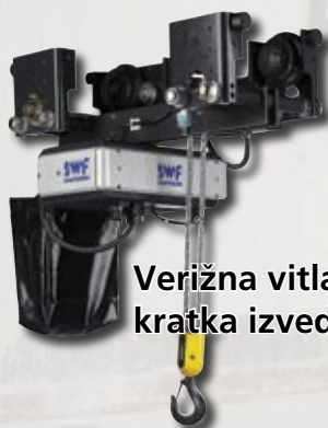
Verižna vitla kratka izvedba