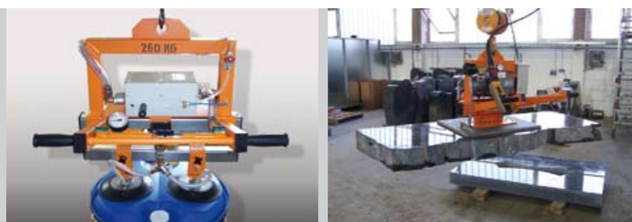
levo: Transport sodov v EX izvedbi 260 kg