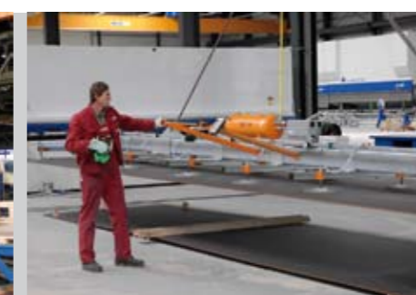
desno: za obratovanje žerjava 3.800 kg 3.000 x 16.000 mm