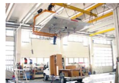
levo: Za karoserije vozil obračanje 180° 400 kg 2.500 x 5.000 mm