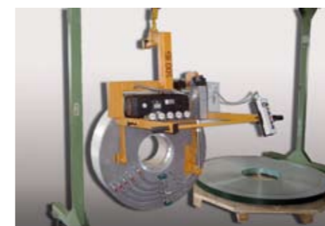
levo: Elevator za zvitke in cepljeni jekleni trak obračanje 90° 500 kg Ø 1.800 mm