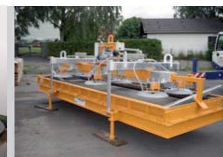
desno: Za beton, s kalupom/brez kalupa 6.000 kg 2.500 x 6.800 mm