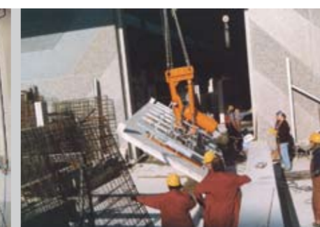
desno: Za betonske gotove izdelke obračanje 90° (hidravlično) 15.000 kg 3.000 x 8.000 mm