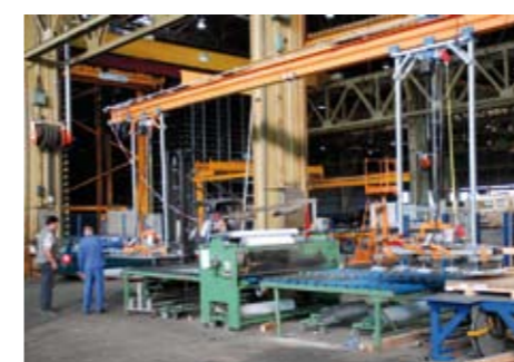
levo: Kompletna nakladalna naprava z dvema vakuumskima elevatorjema (nalaganje in razlaganje) s togim vodilom bremena po 500 kg 1.500 x 3.000 mm