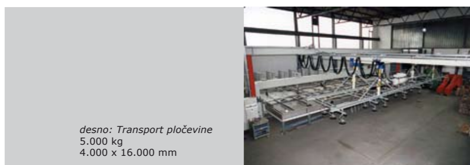
desno: Transport pločevine 5.000 kg 4.000 x 16.000 mm

Slike prikazujejo majhen izsek že izvedenih unikatnih rešitev: