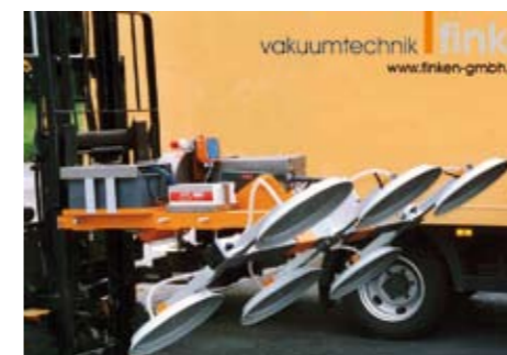
levo: Priključek na viličar z lastnim el. pogonom in daljinskim upravljanjem obračanje 90° 1.500 kg 2.000 x 4.000 mm