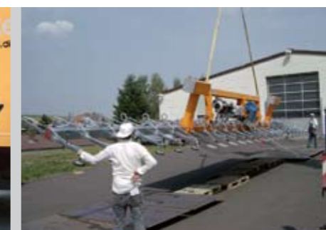
desno: Za tanke pločevine (od t=0,3 mm) ± 95° obračanje pod bremenom Višina elevatorja: 1.200 mm 1.500 kg 3.000 x 14.000 mm